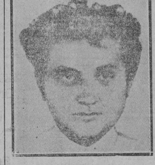
Zinovieff, destacado miembro de la Cheka de quien se habla mucho, como enemigo de Stalin