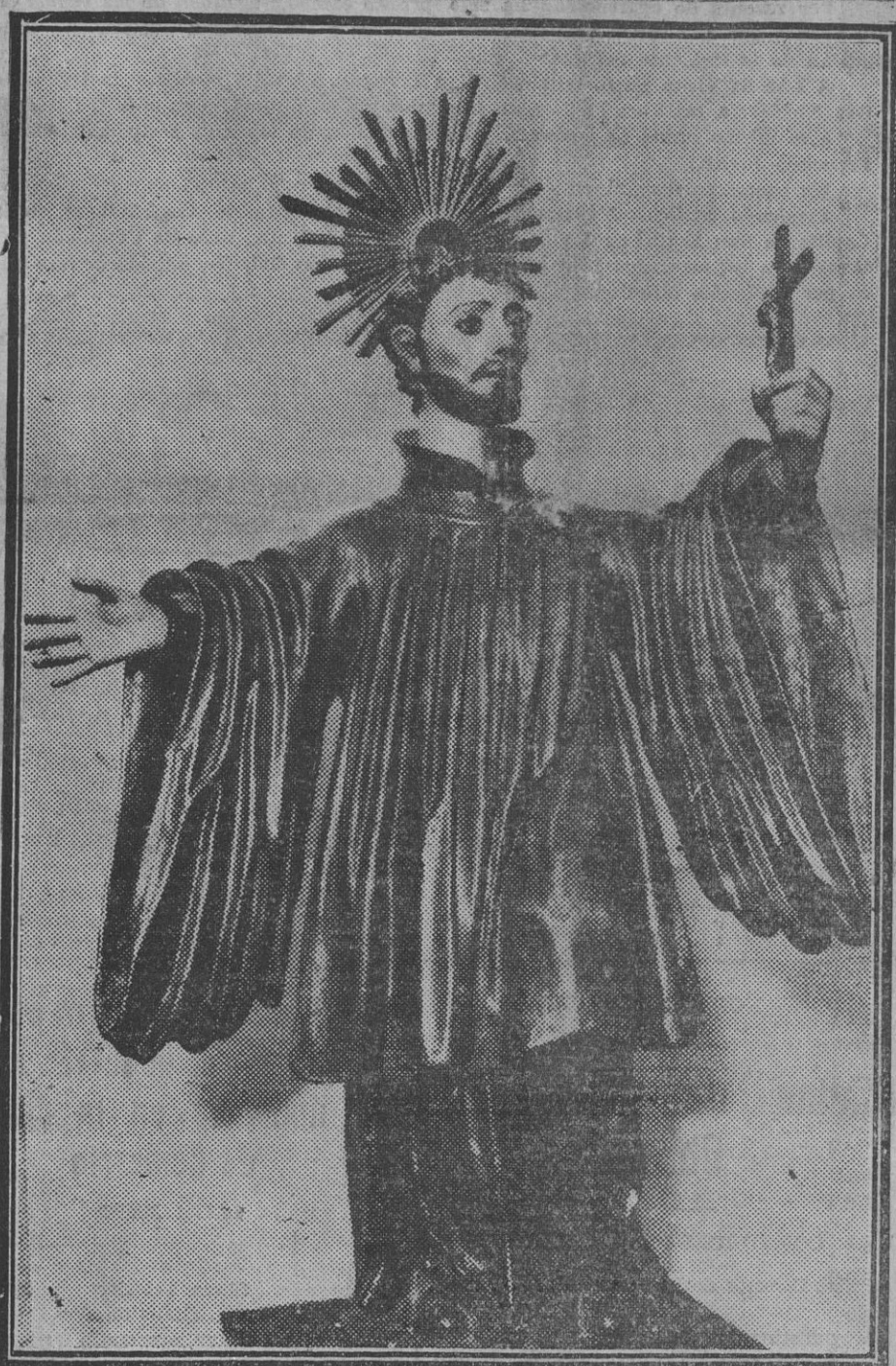
'SAN FRANCISCO XABIER' : Escultura del Siglo XVII que se ha venerado en la Capilla del Santo Hospital, propiedad de la Diputación, y que conserva en el Archivo de la misma