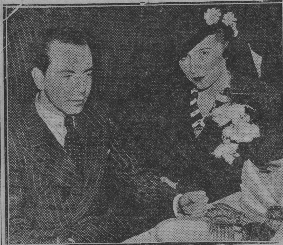
El príncipe Sigvard de Suecia y la señorita alemana Erika Pasek, hija de un fabricante, que recientemente han contraído matrimonio en Londres. El príncipe ha renunciado a todos los derechos de su título, siendo uno más entre los no pocos de su clase que desdeseñan posibilidades de usar unos chimbombos simbólicos de hace ya tiempo muy desdeseñados por los pueblos.