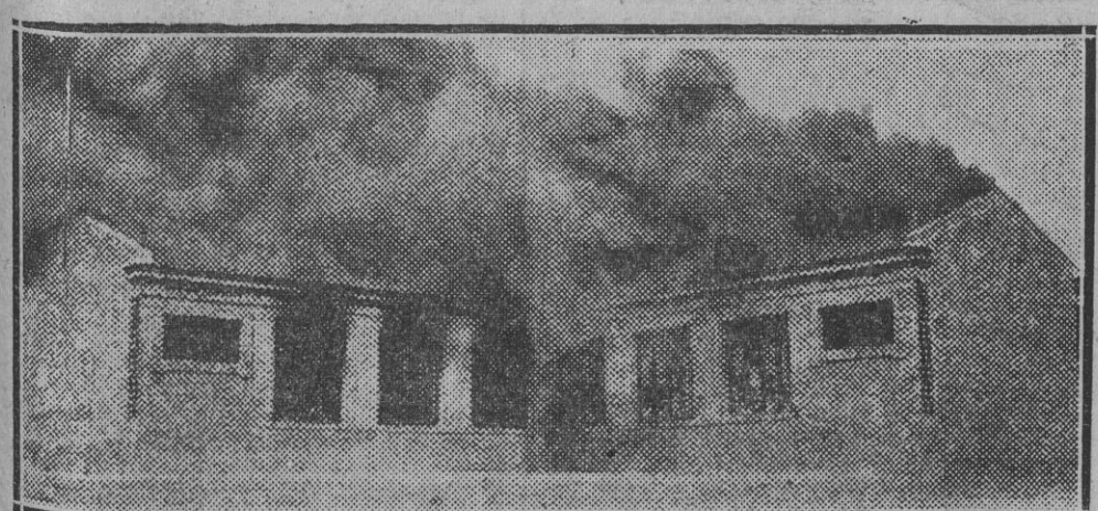
MADRID :: Hazanas de los supervividos de Madrid. Vista del grupo escolar del Cerro del Aire, cuando las llamas lo envolvieron haciendo inútiles los esfuerzos de los bomberos.