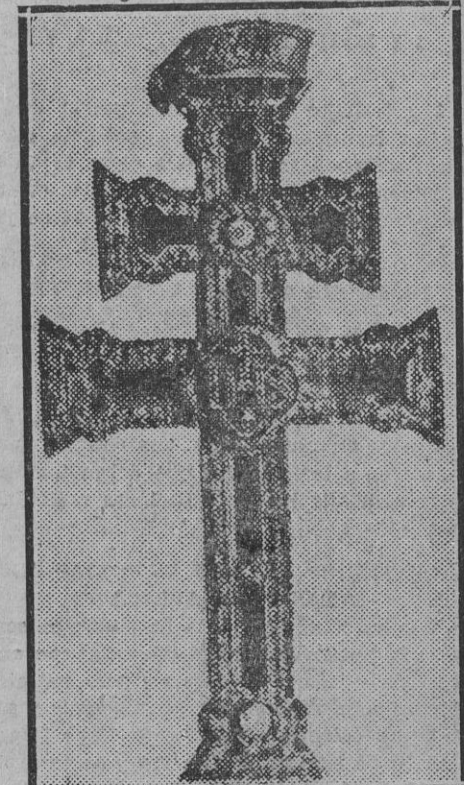
La Cruz de Carayaca (Murcia) preciosísima reliquia, que ha sido robada