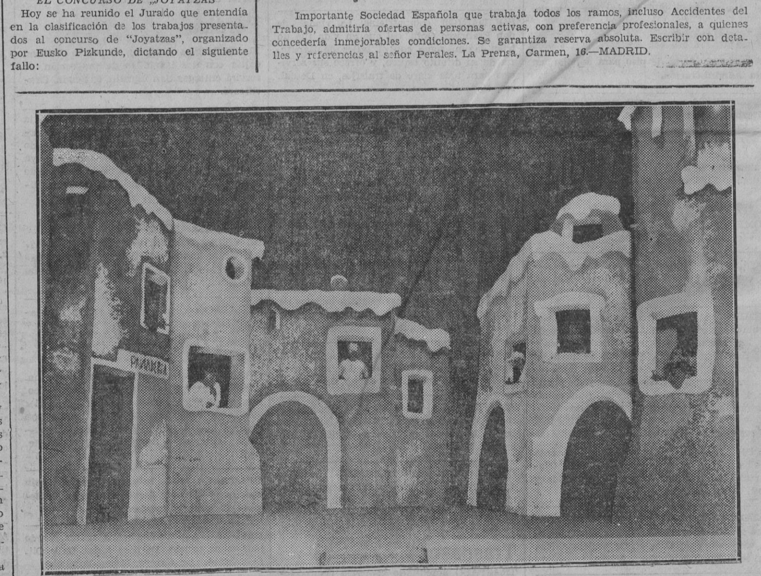
EMMANUEL :: Cuarto acto. Plazuela de Belén en cuyas casas piden infructuosamente hospedaje la Virgen y San José.

Importante Sociedad Española que trabaja todos los ramos, incluso Accidentes del Trabajo, admitiría ofertas de personas activas, con preferencia profesionales, a quienes concedería inmejorables condiciones. Se garantiza reserva absoluta. Escribir con detalles y referencias al señor Perales. La Prensa, Carmen, 16.-MADRID.