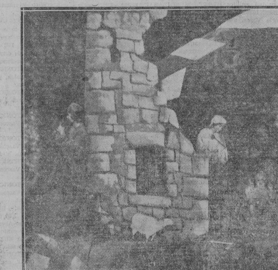
EL "BELÉN" :: (Del encantador "Nacimiento" expuesto en un salón del edificio de los PP. Escolapios,

UNA BELLA OBRA "El Belén" de las Escuelas Pías En estos días en que se inundan de alegría los cristianos corazones, al conmemorar el dichoso advenimiento de nuestro Redentor, el Niño Dios recién nacido echando al mundo la bendición de su infantil sonrisa, suele forjarse un arte, al que siempre, por merecimiento, hemos dedicado atención especial. Tal vez sea ello debido a que de niños nos ha