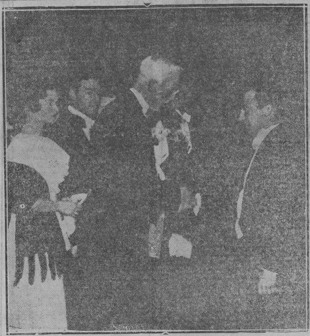
CONCESION DEL PREMIO NOBEL El rey Gustavo de Suecia estrecha la mano otorgado el premio Nobel de Física, en el solemnísimo acto de la distribución celebrado en Stokholm