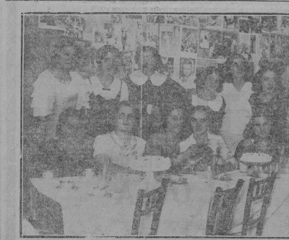
Uno de los buenos "falleres" de Pamplona convertido en salón de fiestas el día de ayer

El Gobierno recompensará a los distintos elementos militares y civiles, como los ferroviarios, que han prestado servicios valiosísimos, que han cooperado con entusiasmo enaltecedor a la sofocación de los sucesos.