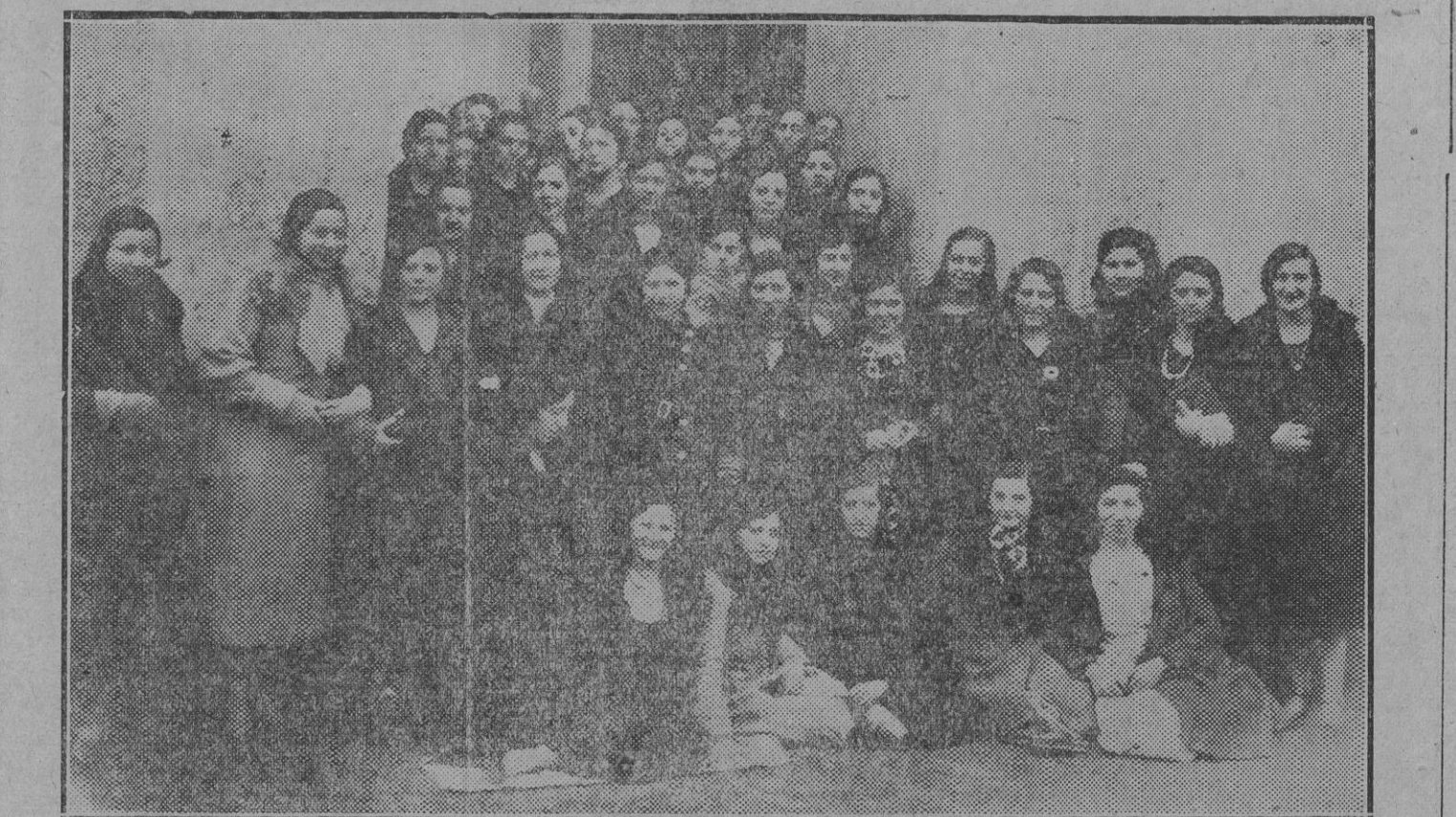
Uno de los grupos de lindas modistas que ayer celebraron alegremente la festividad de Santa Lucía