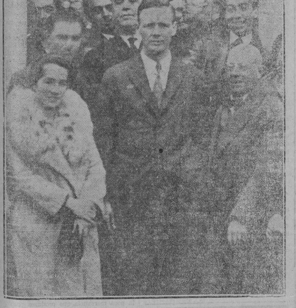
Lindberg y su señora que han tenido que aterrizar dos veces en España