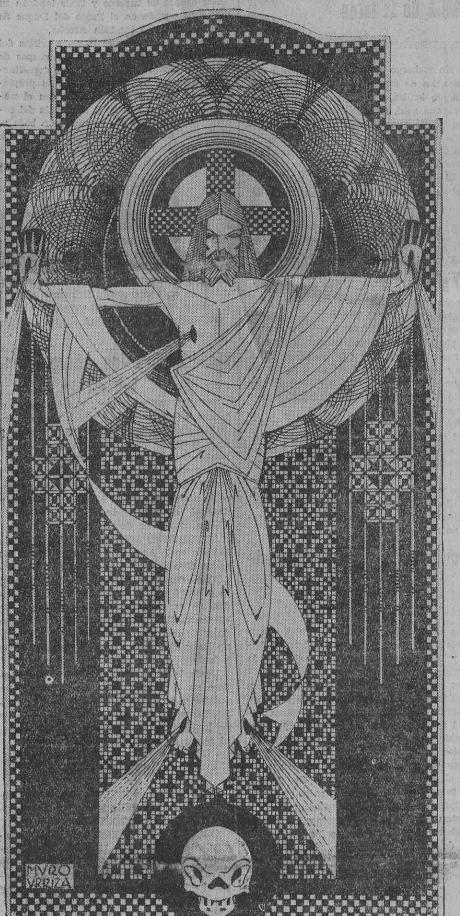
¡RESURREXIT! (Por Muro)

zados sus discípulos, y se pretende ahogarla en sangre desde la Cuna. Hemos oído hablar tantas veces de las persecuciones y de los martirios de los primeros siglos del Cristianismo, que se nos figura que los tenían que sufrir con la mayor naturalidad. ¡Pero qué esfuerzo tan increíble tuvieron que realizar para superarlas!