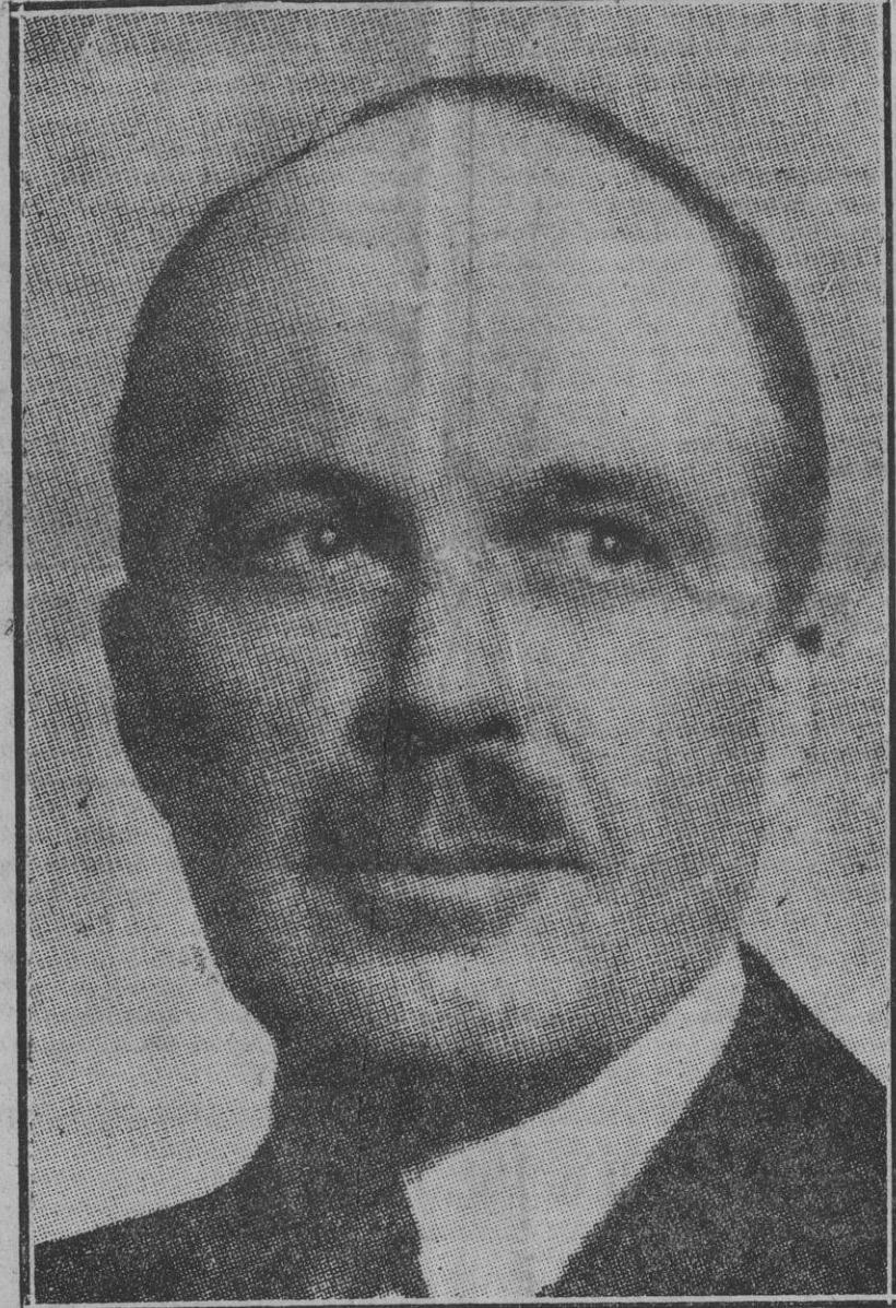
El profesor W. L. Bragg, de Manchester, que comenzó a enseñar en la cátedra de Cajal, del Instituto Nacional de Física y Química, un curso de conferencias sobre "Estructuras cristalinas". Al profesor Bragg le fué adjudicado, en unión de su hijo, el Premio Nobel por sus descubrimientos y trabajos en dicha materia.