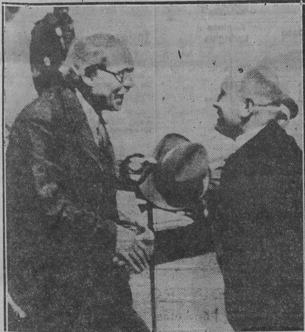
Momento en que Mussolini estrecha la mano a Mac Donald al descender del hidroavión