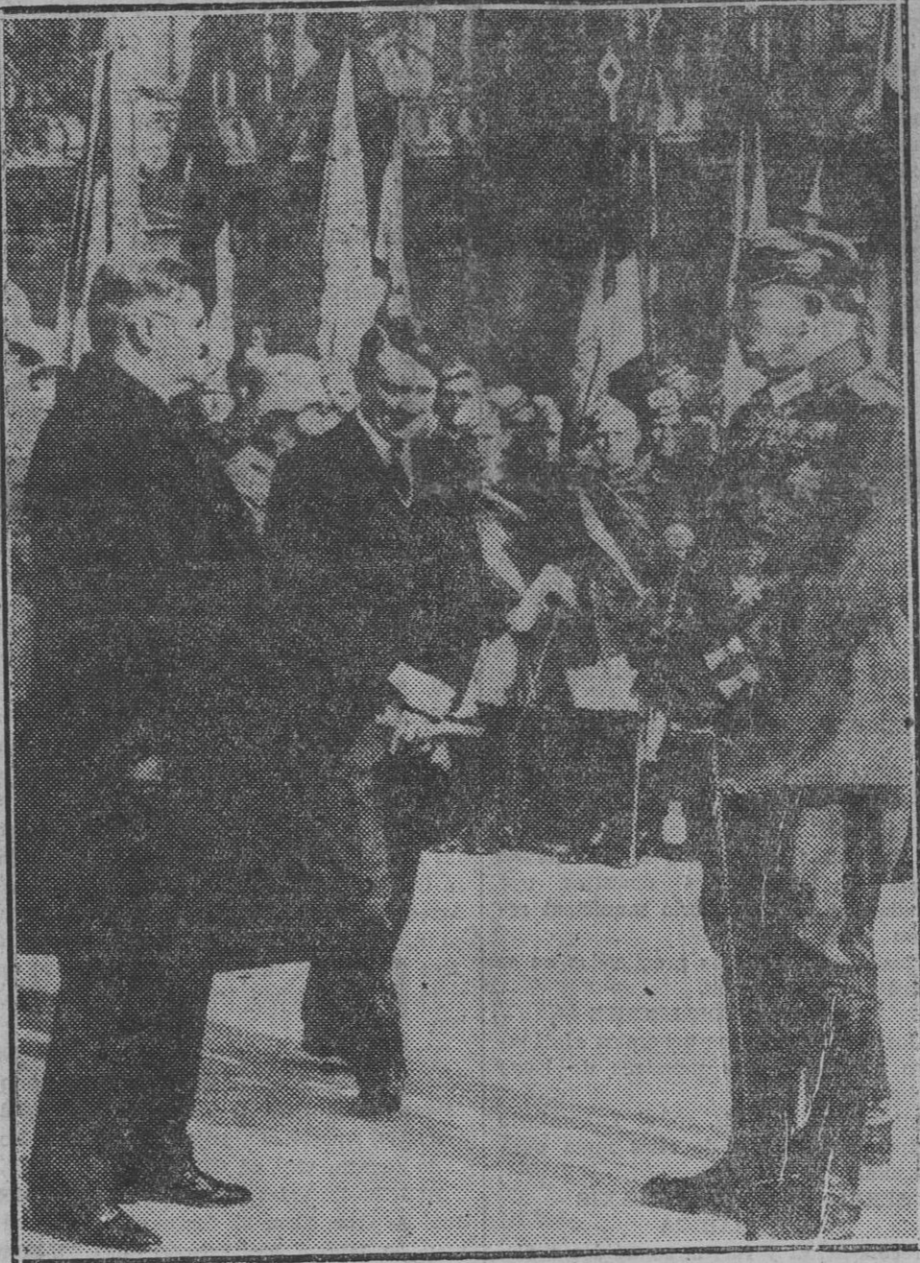
Después de los funerales por los muertos en la guerra, los "nazis", las tropas, el Gobierno, e Hitler al frente de todos desfilan ante Hindenburg.