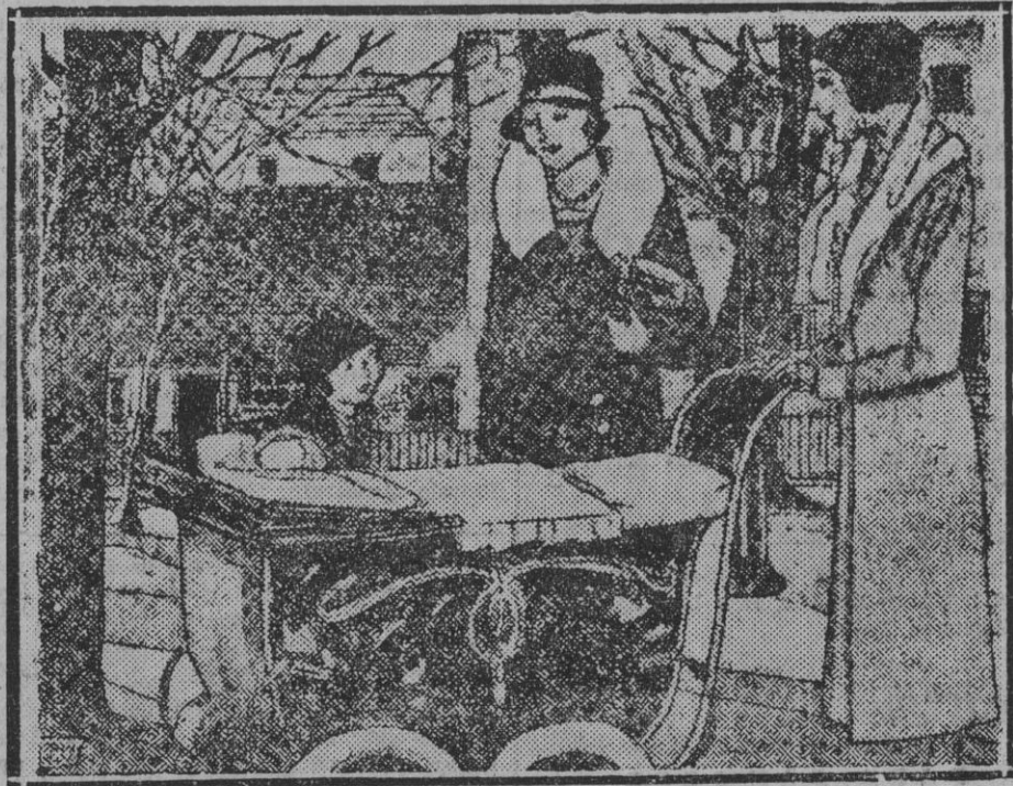
--Oh, qué niño más hermoso! ¿Qué tiempo tiene? --Dos meses. --Es el menor de los de usted? ("Life", Nueva York)