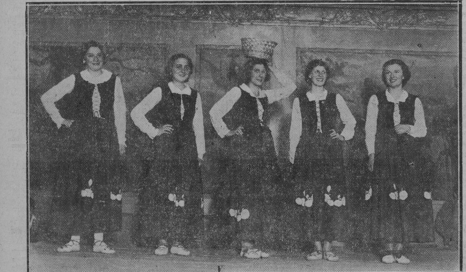
LA VELADA DE EMARUME ABERTZALE BATZA.—Las gentiles señoritas que bailaron el sagardantza.