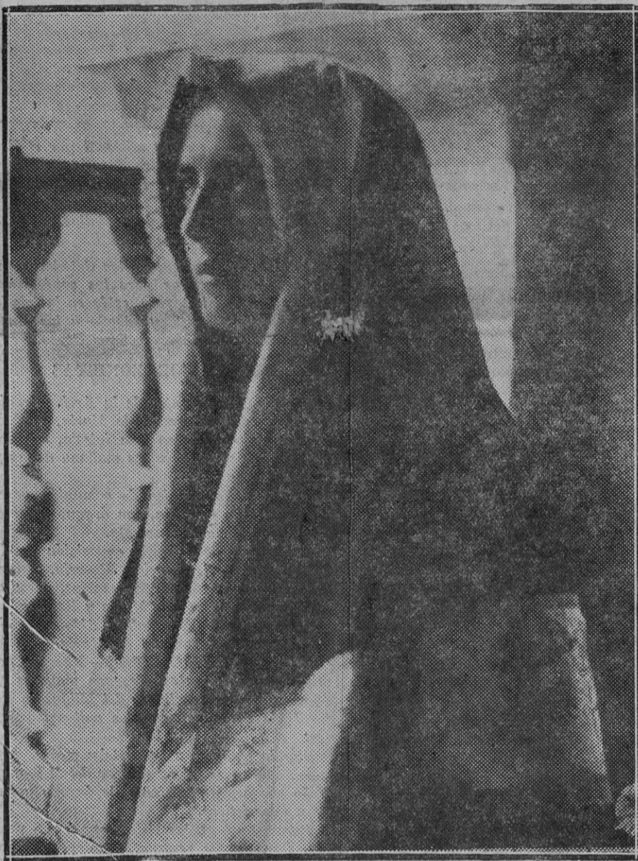
Bellísima joven, ataviada con la clásica mantilla