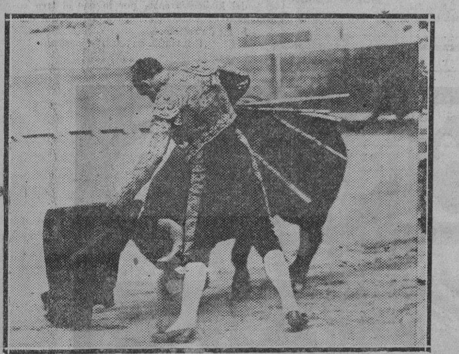
Barrera en un pa se de los de factura.