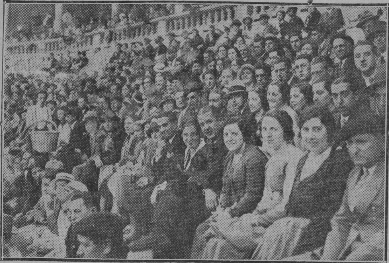
Un tendido completamente "formal".