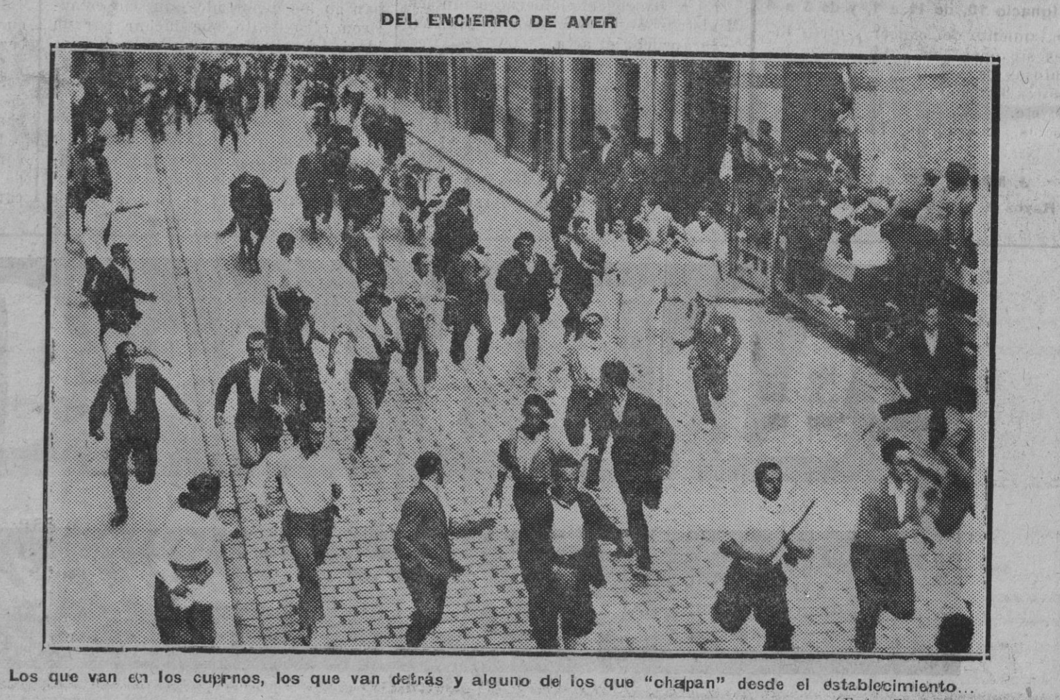
Los que van en los cuernos, los que van detrás y alguno de los que "chapan" desde el establecimiento.