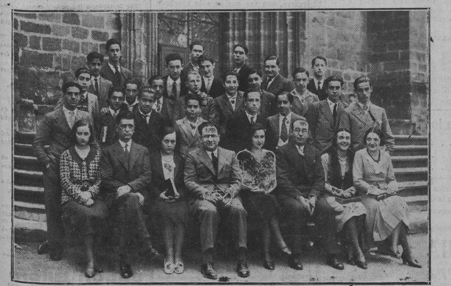
Los nuevos Bachilleres que han terminado sus estudios en el Instituto con sus profesores (Foto Gerardo Zaragüeta).

hecho de obtenerse circunstanciales ventajas. Mas salvando estos principios que se trata de reindicar acomodadas a las normas que imponen las diferencias de los tiempos, y teniendo presente que pudieran derivarse algunas ventajas para el país, sobre todo en cuanto se refiere a la enseñanza, la Comisión Tradicionalista, por ello, afirma su simpatía a todo lo que signifique progreso en este orden, simpatía que pudiera trocarse, en motivada censura si en el regaleo parlamentario quedaran frustradas estas ventajas que son las únicas que pudieran dispensar otros graves errores que el Estatuto contiene. Estos antecedentes que fueron siempre norte y guía de la actuación tradicionalista, imponen a esta Junta la necesidad de remitir a la conciencia y discreción de sus asociados su individual actuación, para la emisión del voto a que se refieren.