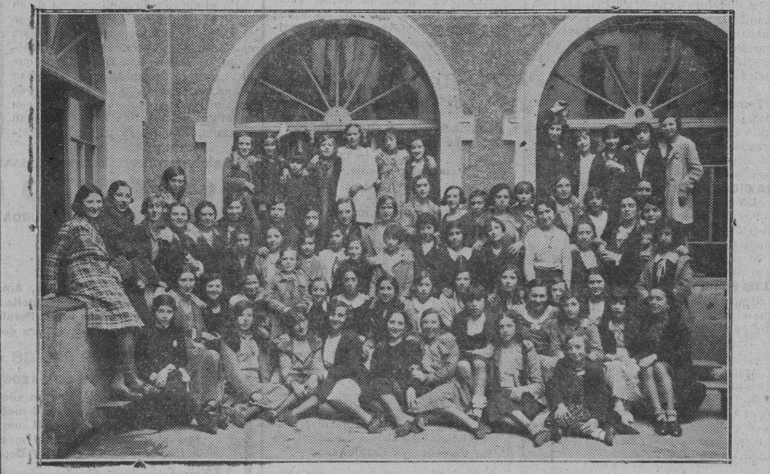
Grupos de profesores y alumnas de la Escuela Dominical de la Sagrada Familia, que ayer celebraron una agradable fiesta con motivo de honrar la Festividad del día..