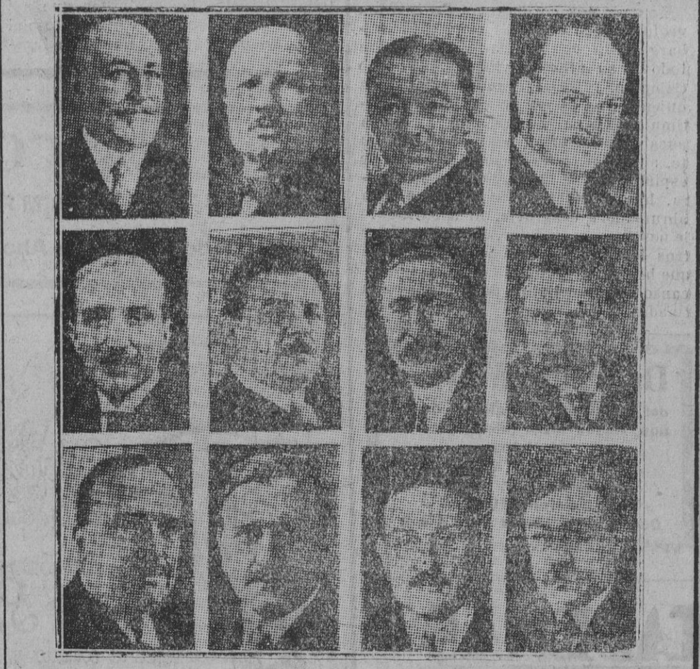
Señores Buisson, de Monzie, Reynaud, Flandin, Champetier de Ribes, Herriot, Blum, François Albert, Tardieu, Daladier, Chautemps y Painlevé