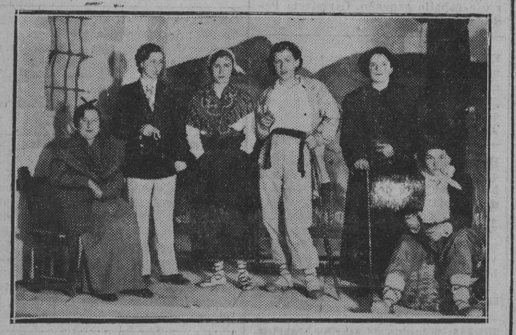
Las simpáticas e infatigables "Emakumes" de Leiza q. han representado con gran éxito la obra euzkérica, "Iziartxo-Astedihak". Uno de los episodios culminantes de la velada.