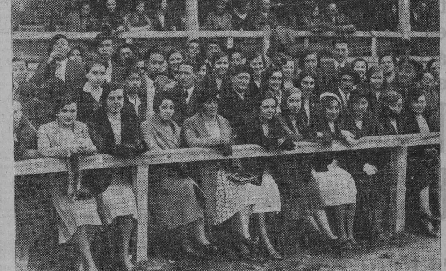
Bellas espectadoras de preferencia que también saben sentir la emoción de estos días de partidos espectaculares y que sin duda refuerzan el ánimo de los "rojillos". (Foto Gerardo Zaragüeta).