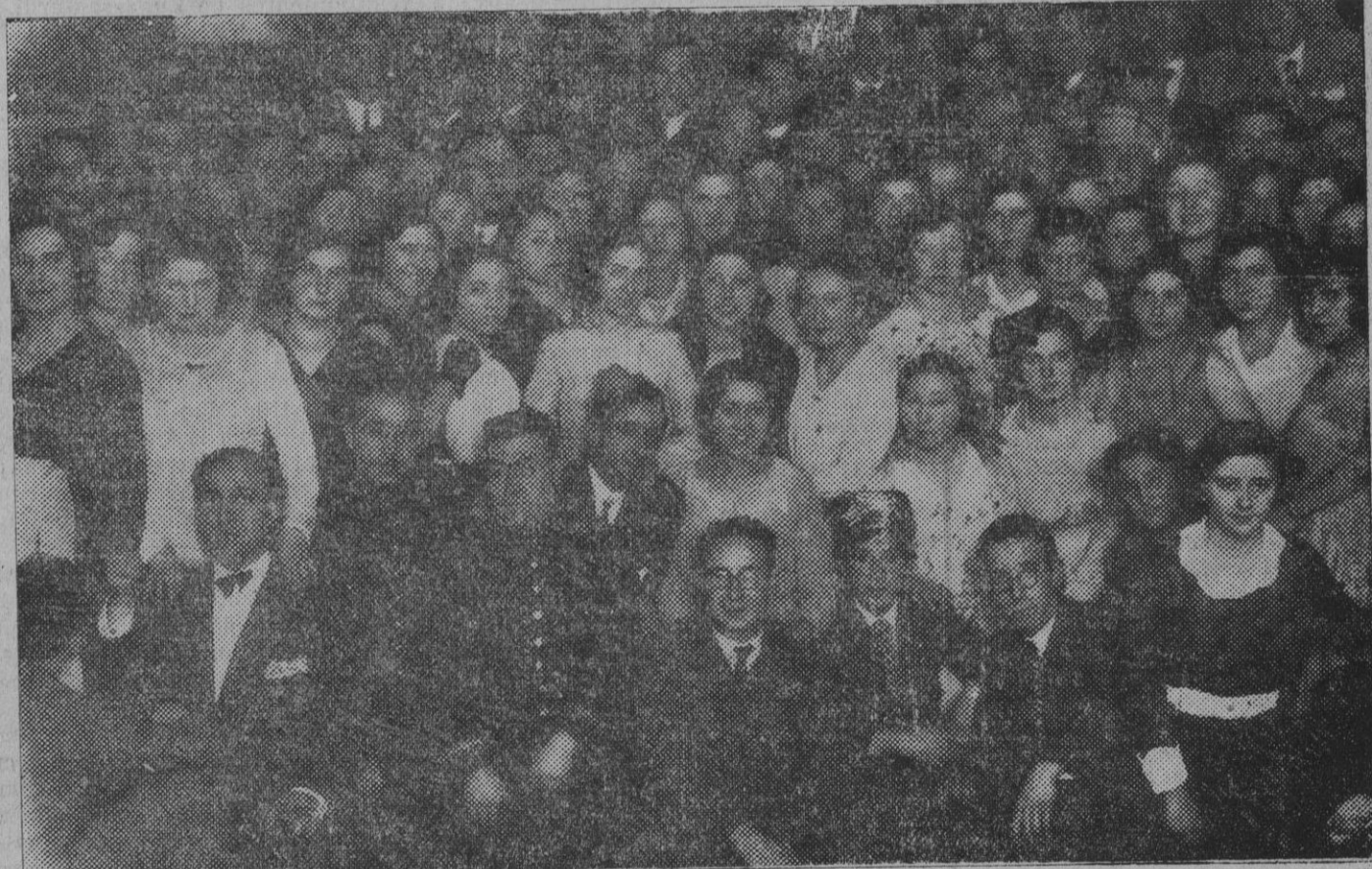
Un descanso en el baile organizado por los "Amigos del Arte" para despedir el Carnaval. (Foto Gerardo Zaragüeta).