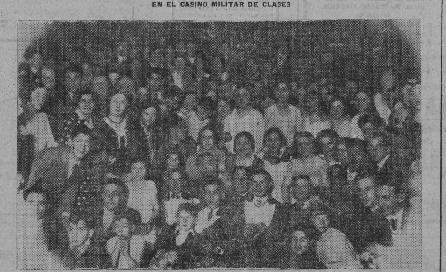
Concurrentes al baile que el domingo de Piñata tuvo lugar en el domicilio social.

De acuerdo con lo que dispone el artículo 16 de los Estatutos sociales, para el derecho de asistencia a dicha Junta se requiere poseer diez o más acciones y tenerlas depositadas en la Caja Social o en algún establecimiento de crédito, tres días antes por lo menos al señalado para la celebración, acreditándolo con la exhibición del correspondiente resguardo. Pamplona, 15 de Febrero de 1932. Por acuerdo del Consejo de Administración, El Presidente, Senario Hulci.