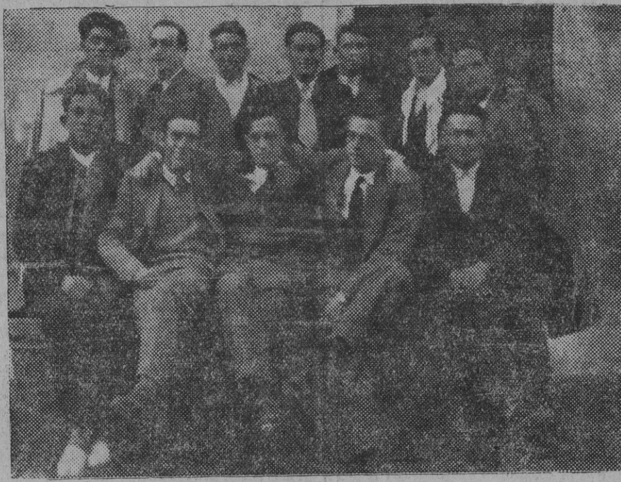
DE PERALTA.—Grupo de muchachos que han pasado alegremente las fiestas de San Blas

el mejor para el lavado de la ropa. Depósito en Pamplona Sra. VIUDA DE IPUJO