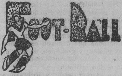
NUEVO TRATO A LOS INTERNACIONALES

Con arreglo a la nueva reglamentación, los jugadores internacionales reciben un sueldo material de la Federación Española. A cada jugador que viaje por cuenta de la Federación, se le darán 30 pesetas diarias para sus gastos, aparte de tener cubiertos todos los oficiales de la expedición en primera (en hoteles, trenes, etc.). Por cada partido internacional que empiece percibirán 100 pesetas; por cada victoria 250 pesetas y 50 por goal marcado.