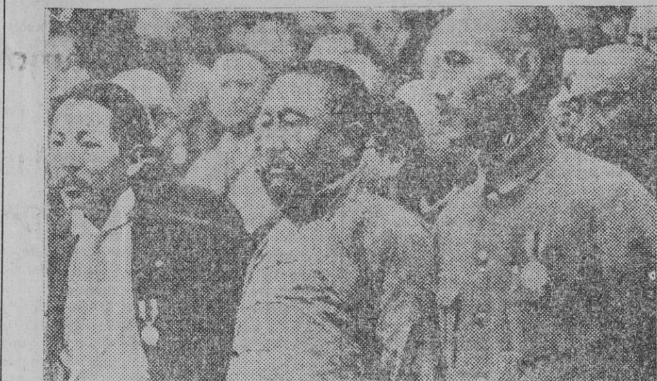
El general Chang-Kai-Chek en la asamblea de generales reunida ante el avance de los japoneses, que le eligió generalísimo de las tropas chinas

la misma idea, pero en términos más enérgicos.