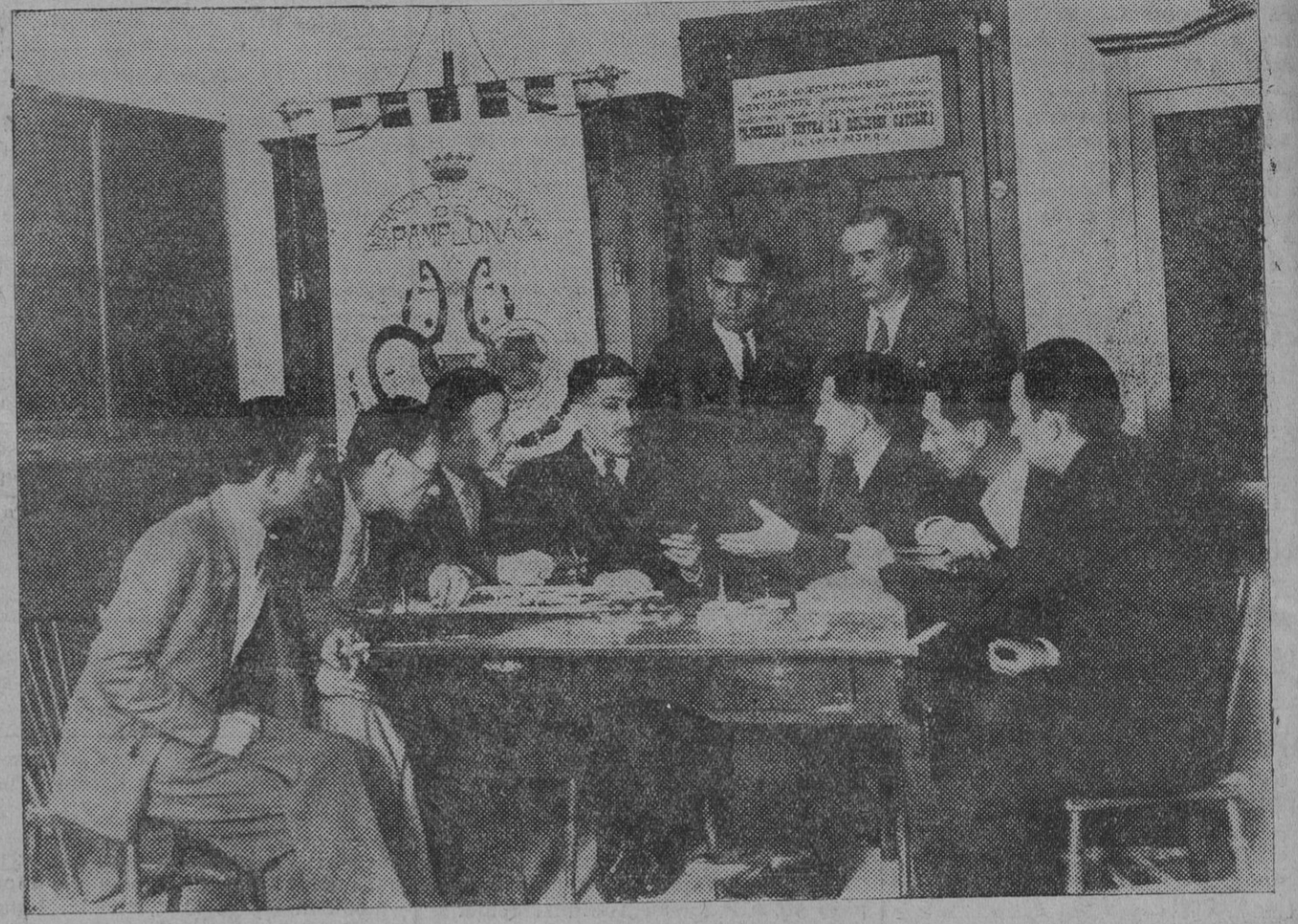
Con febril entusiasmo cuentan los directivos de "La Pamplonesa" al Reporter de LA VOZ DE NAVARRA, lo que fueron, lo que son, y lo que desean ser.