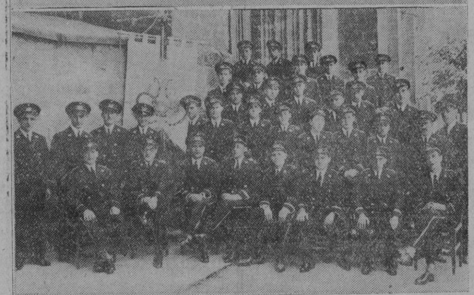
La popular banda de música "La Pamplonesa", en el año de su fundación y en el actual.