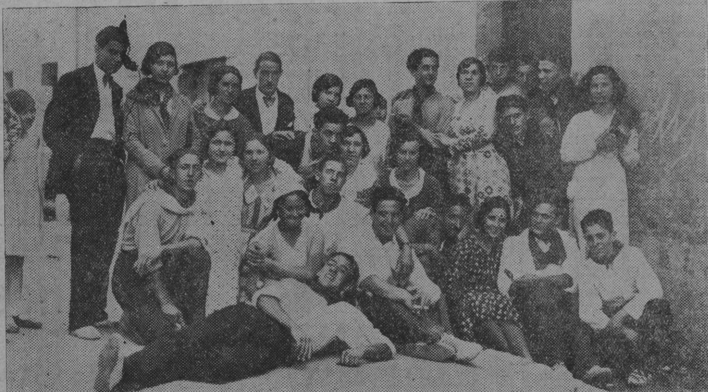
Un grupo de alegres jóvenes esperando la hora de dar comienzo al baile.