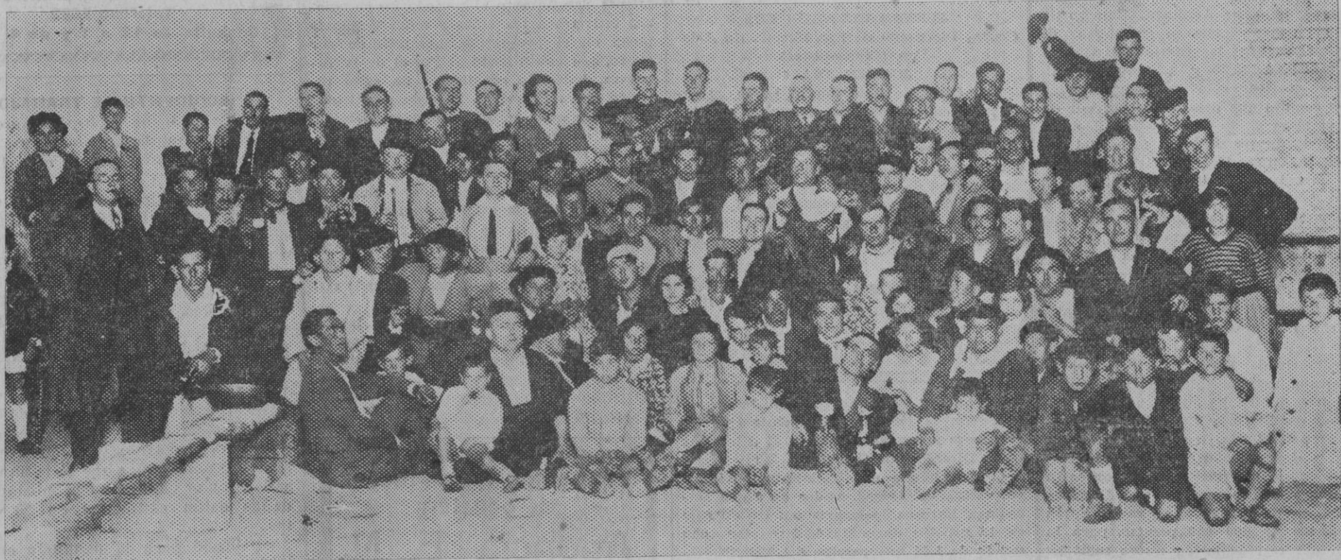
Componentes de la Peña Los Irushomes que el domingo realizaron su acostumbrada excursión anual a Irurzun.

De los periódicos: "Según comunican de Leningrado, el Gobierno español ha negado la necesaria autorización para que el vapor "Ukrania" se detenga en puertos españoles en el curso del viaje de propaganda que acaba de emprender por Europa. El artículo de propaganda que lleva a bordo el "Ukrania" consiste en cincuenta "héroes de Piatitzka". Ignoramos, y no han sabido decirnos los comunistas más viejos de la comarca en qué se diferencian los de Piatitzka de los demás héroes, ni en qué radica su heroicidad. No tenemos sino embargo, por qué dudar de que sean héroes genuinos. Mas el Gobierno de la República estima sin duda que para héroes de propaganda tenemos bastante con la producción nacional." Con esa prohibición hemos perdido una ocasión magnífica de leer unos cuantos artículos de "Amexia" y eso es lo único lamentable. ¿O es que desde la cara de los republicanos ya no escriben? "El reloj marca las doce y tengo que marcharme. ¡qué fatalidad!" El reloj marca las doce y tiene usted que marcharse y por si esto fuese poco para usted es una fatalidad, aue-