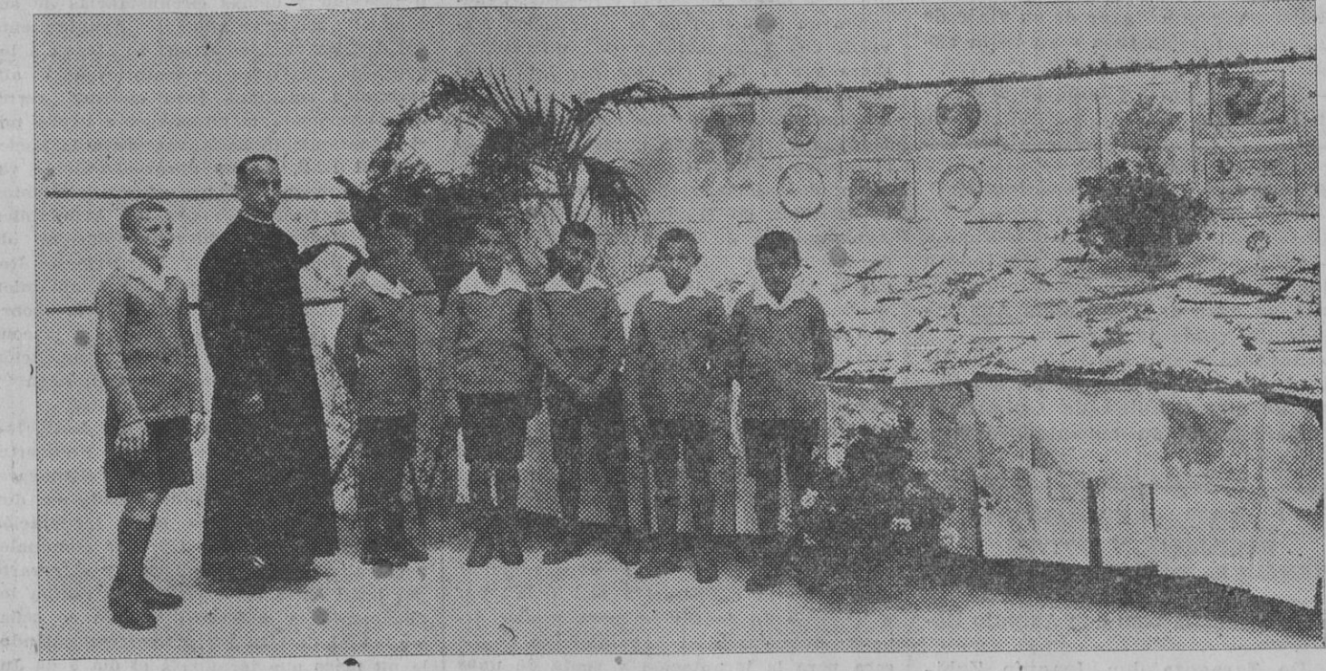
El capellán de la Santa Casa Misericordia y algunos de los asilados, en la exposición escolar de dicho centro. (Foto Zaragüeta).