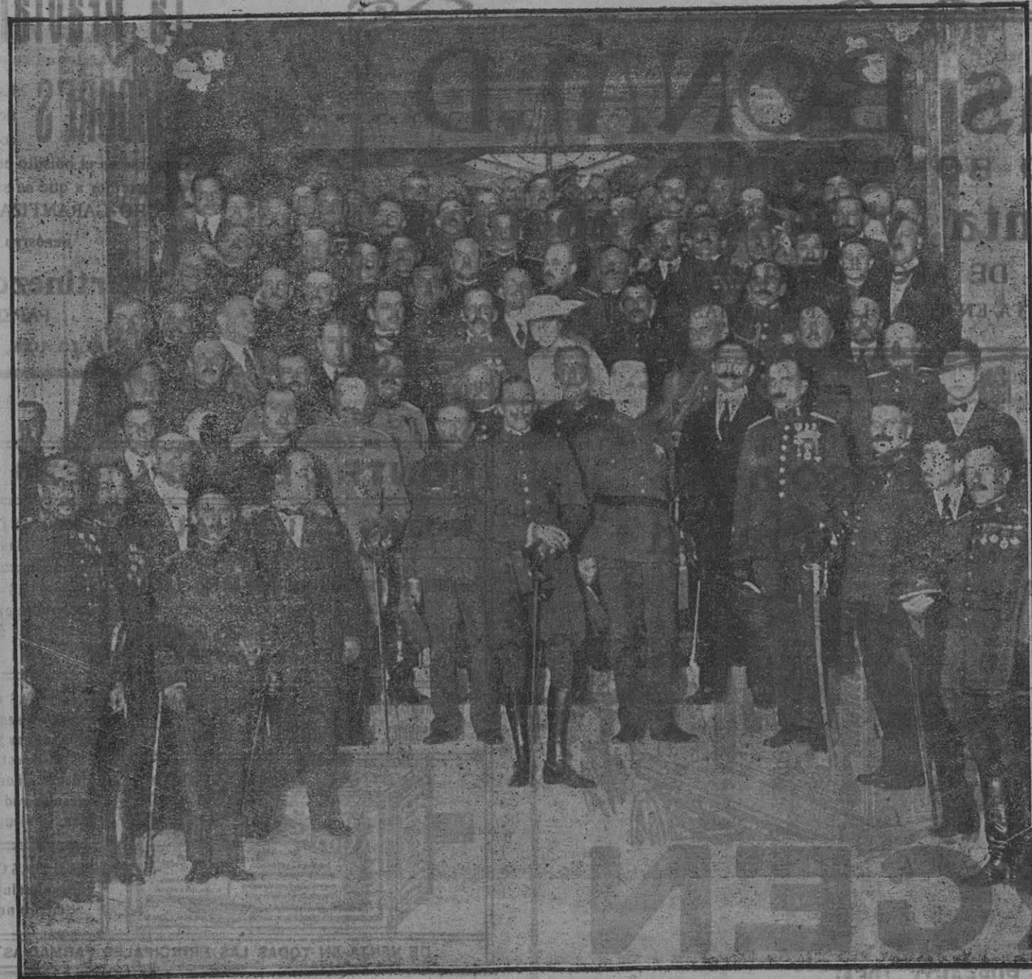
Su Majestad el Rey saliendo de presidir el banquete.