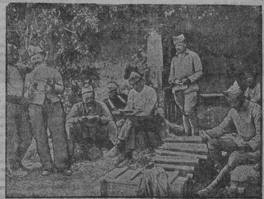
Depósito de municiones de la Artillería francesa.

Nuestras tropas han estrechado de cerca al enemigo y se han apoderado de Bazoches, Perles, Fismettes y Basieux.