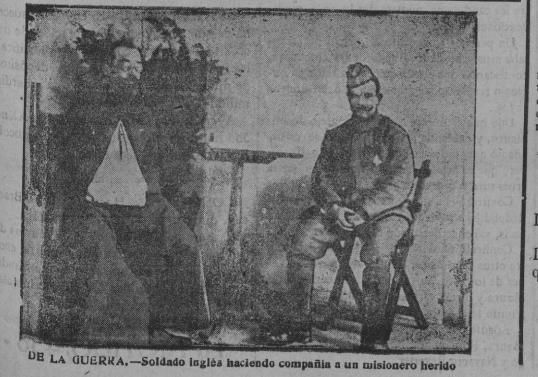
DE LA GUERRA.—Soldado inglés haciendo compañía a un misionero herido

ESPAÑOL.—A las 10, Me gustan todas y El ladrón. PRINCESA.—A las 9,45 La mujer X. COMEDIA.—A las 10, El rayo. ESLAVA.—A las 6, A campo traviesa. A las 10,30, La del alba sería... y Jesús María y José. ODEON.—A las 10, Juan José. A las 6 (cinematógrafo), La historia de los trece y La niña mimada. LARA.—A las 6, Pipiola (tres actos). A las 6, En un lugar de la Mancha. APOLO.—A las 10,30 (doble), El niño judío (dos actos). A las 6,15 (doble), El contrabando y El príncipe bohemio (reestreno). COMICO.—A las 6,30, Las buenas almas y Los campesinos. A las 10,15, Las buenas almas y Las hijas de España. PRICE.—A las 6 y a las 10, Maruxa y canciones españolas por Mercedes Capisir. CERVANTES.—A las 10,15, El hombre invisible. A las 10,15, El hombre invisible. Sindicato de Publicidad.—Barbieri, 8.