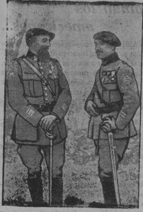
El comandante de un batallón de Cazadores que tomó el monte Tomba.