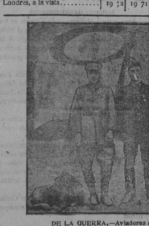
DE LA GUERRA.—Aviadores americanos, al servicio de Francia