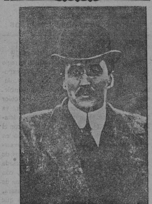
Mr. Lansing, ministro de Negocios Extranjeros de los Estados Unidos

Al fin pudo ser sacado el coche. La Reina terminó de repartir sus raciones, y ocupando de nuevo el «auto», marchó del Asilo, entre las aclamaciones de la muchedumbre.