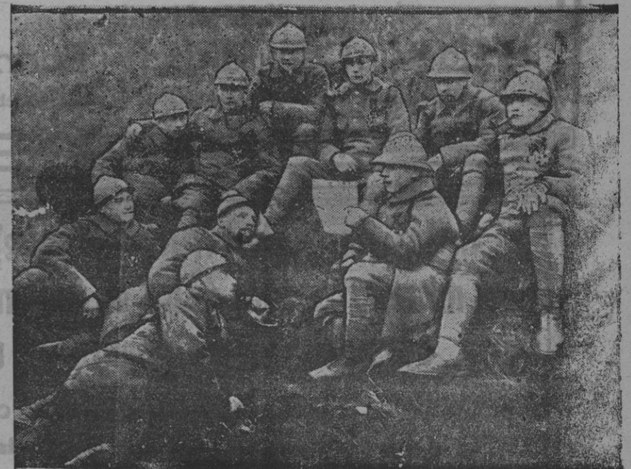
Un descanso en el frente.

ZÜRICH 30.—El corresponsal del Berliner Tageblatt dice que desde el lunes tomaron las huelgas en Alemania una extraordinaria extensión. Según las informaciones oficiales que deban considerarse como muy inferiores