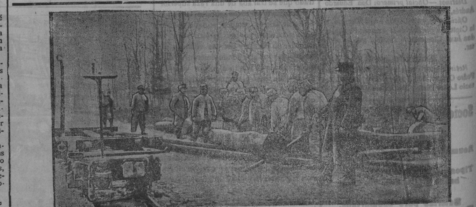
Tala de un bosque en las proximidades de Lorena.

Los alemanes amenazan con castigar a la población si los cuatro hombres considerados como promotores no les son entregados antes de 1.º de Febrero.—(Radio).