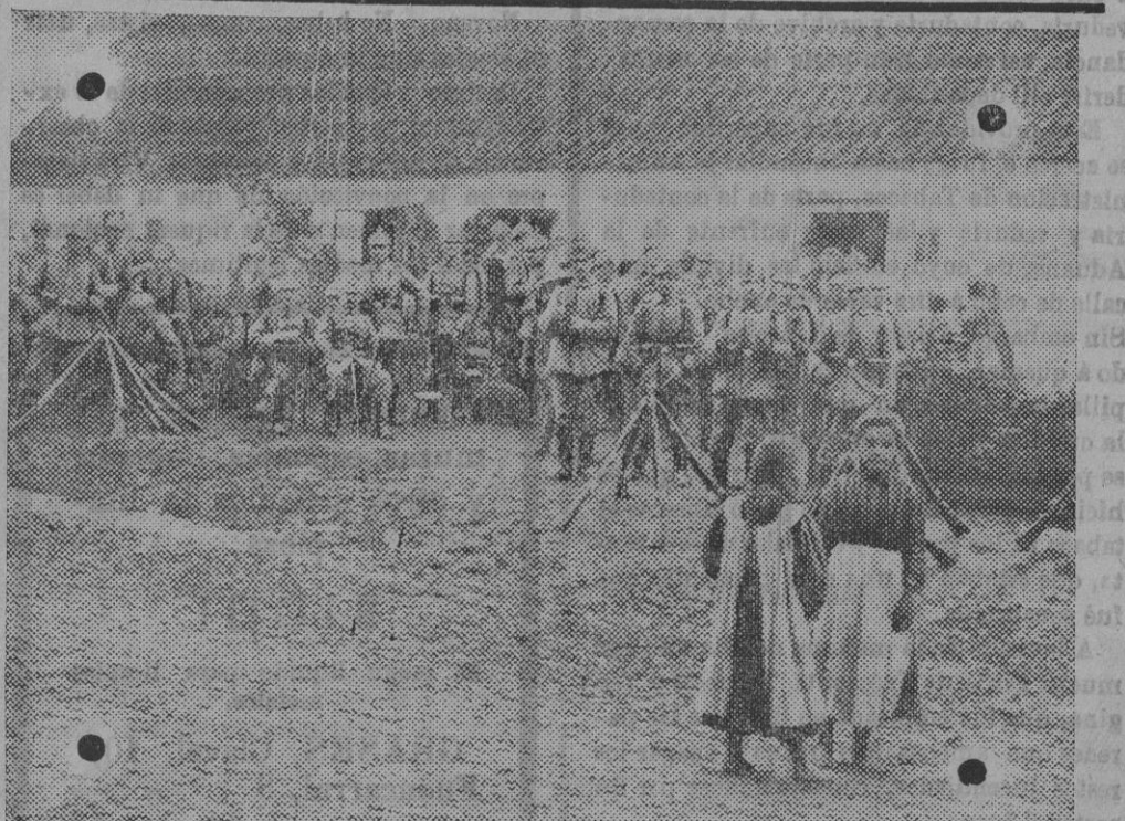
Un alto de tropas alemanas en un pueblo cercano a Lieja, que van a reforzar el frente alemán en Bélgica.