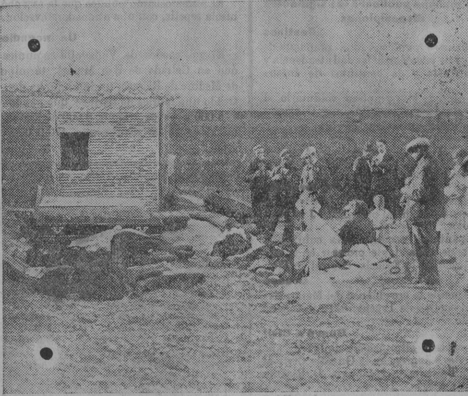
Desolador aspecto del cementerio de Pozaldez, donde fueron conducidas las víctimas de la catástrofe.