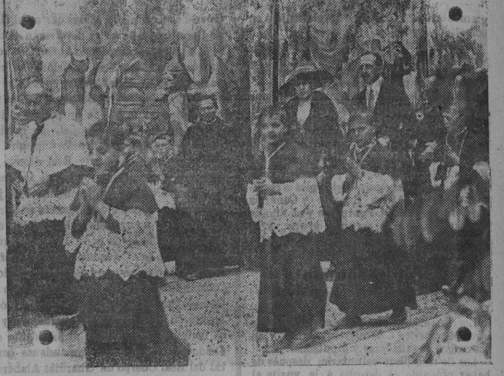
Los Majestades los Reyes al entrar en la escuela s... de la ronda de Atocha adónde han ido sus Majestades para presidir la colocación de la primera piedra del edificio de la Escuela profesional de Artes y Oficios.

Muebles económicos. Facilidades en el pago. Proveedores de la Cooperativa del Ministerio de la Guerra y Alabarderos. HIJOS DE M. GRASES Clavel, 10 (esquina á Infantas) y Atocha, 16