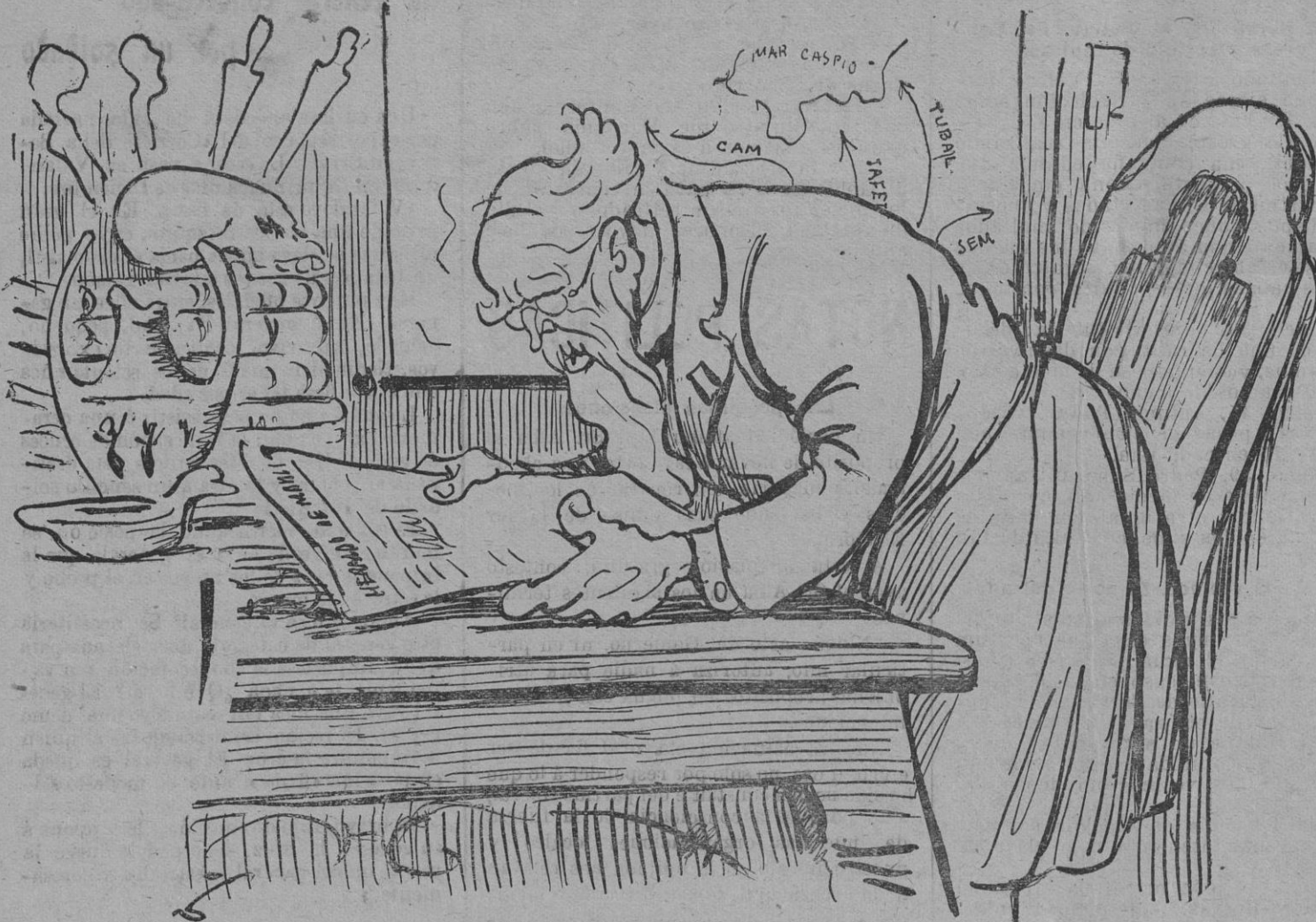
—¡Qué Tigris ni qué Eufates! El verdadero, el auténtico Paraíso terrenal debió de estar en el propio Grañén, provincia de Huesca!