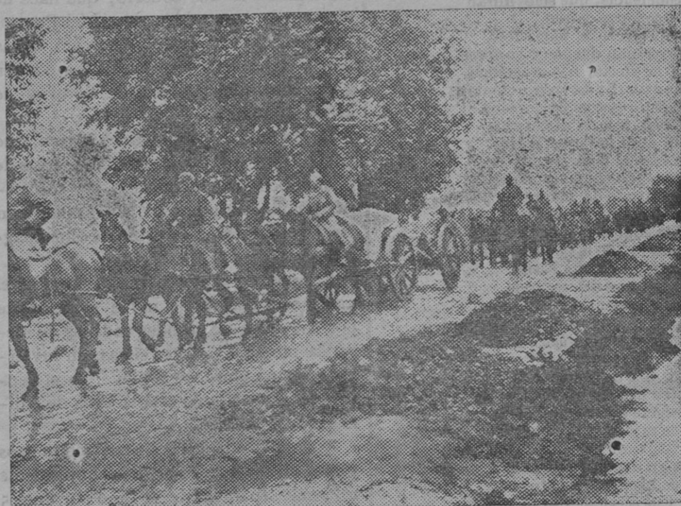
Avance de la Artillería alemana por los pésimos caminos de los alrededores de Dvinsk (Dvinsk) en persecución de los rusos.

Culpa de nuestra imprevisión incurable, de nuestra pasividad, de nuestra inercia. Los cultivadores y exportadores de bananas debieron a su tiempo organizarse solidariamente y procurar y ordenar los medios de resistencia contra los concurrentes extranjeros. No lo hicieron así porque en Canarias es imposible la acción concertada, la asociación cooperativa para cosa ninguna; y ahora es tarde, y además el espíritu refractario a esas empresas manifiéstase más fuerte que nunca. Hoy la desconfianza en el porvenir separa y aísla irremediablemente a los que, de todos modos, en ninguna ocasión se hubieran unido. Han menguado los capitales que creó el cultivo y el comercio de frutos; algunos han desaparecido por completo en la actual vorágine, otros corren riesgo inmediato de desaparecer y no pocos están en el aire siendo más ficticios que reales. Hay una disolución lenta de la fuerza