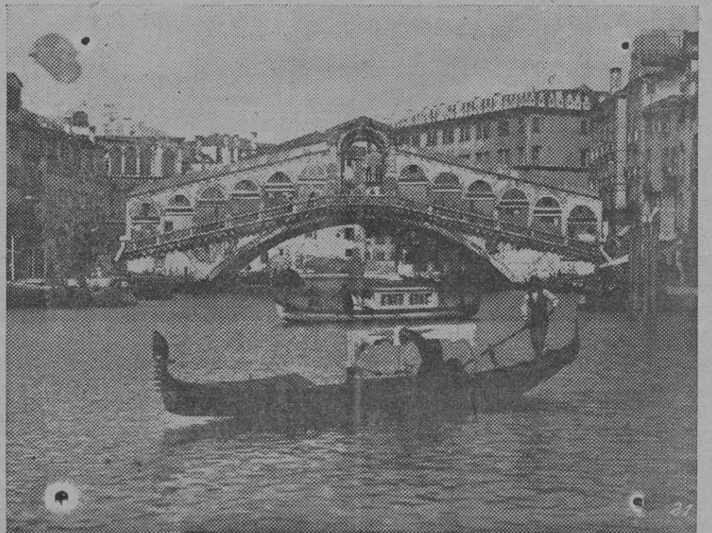
El puente Rialto de Venecia.

«El Mundo», tratando del mismo asunto y coincidiendo con «Diario Universal», en que en las condiciones en que se encuentra la República lusitana es imposible la paz moral de que algunos hablan,