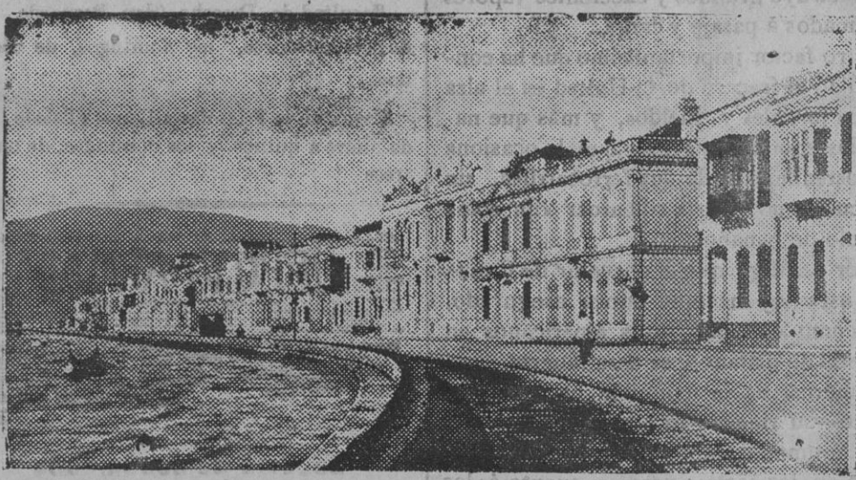
Los muelles de la ciudad de Smirna.

En Argona el enemigo ha intentado, al terminar la tarde del 14, un tercer y violento contraataque para reconquistar trincheras que les quitamos entre el Four de París y Bolante; pero este contraataque, como los anteriores, fué rechazado.»