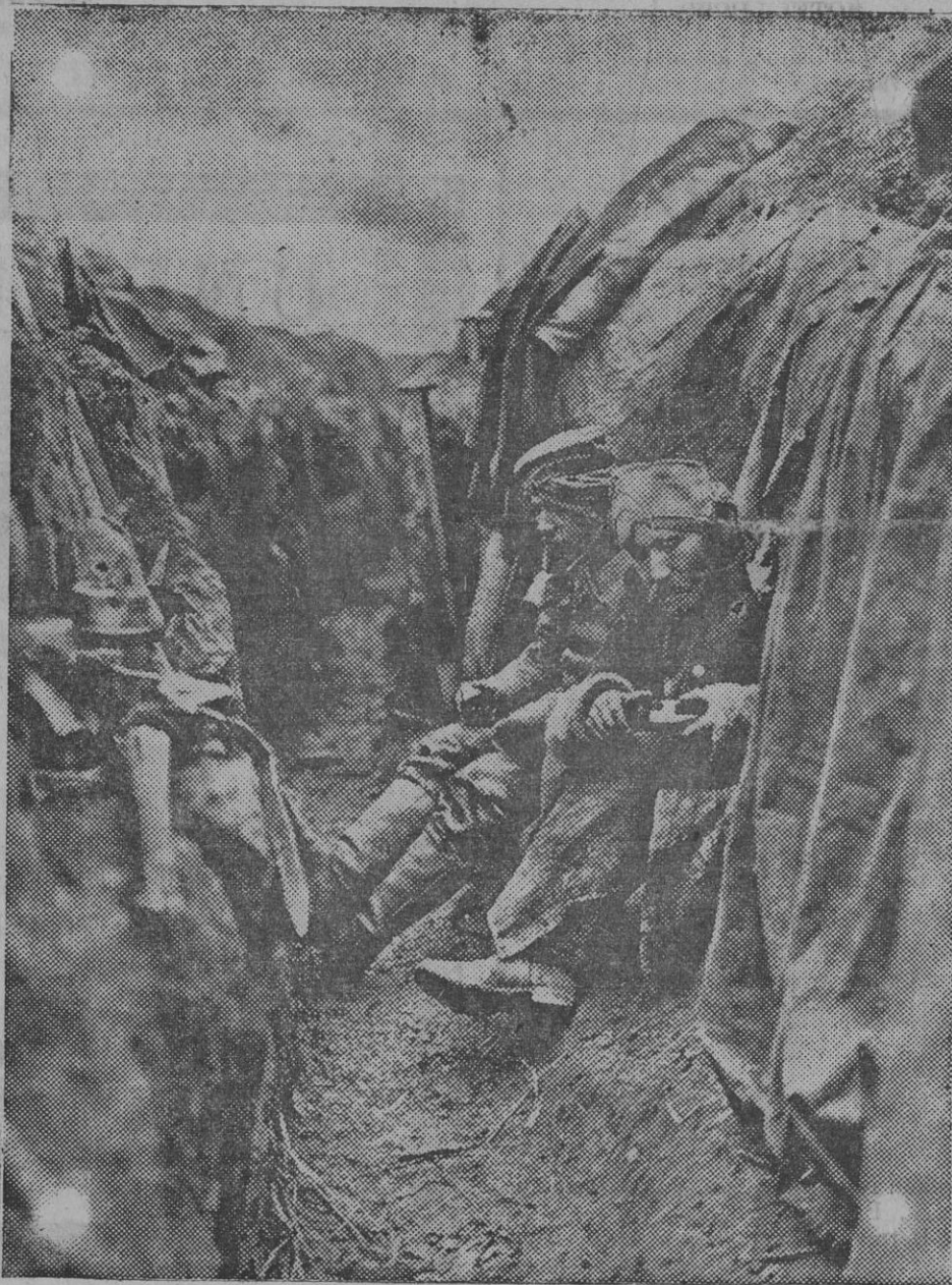
A OCHENTA METROS DEL ENEMIGO. —Soldados de la reserva alemana en una de las trincheras más próximas al enemigo en los campamentos de Francia.

vías de realización, son interesantísimos y tienden a fomentar esa gran riqueza perdida, ó poco menos, en España, que constituye la ganadería hípica.