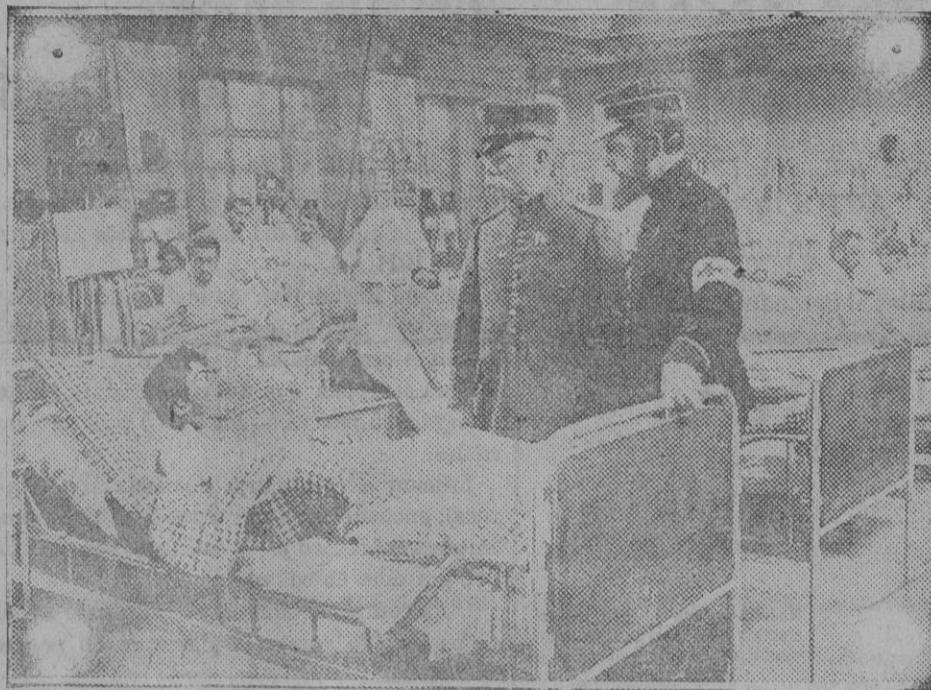
El general Joffre visitando un hospital de sangre.