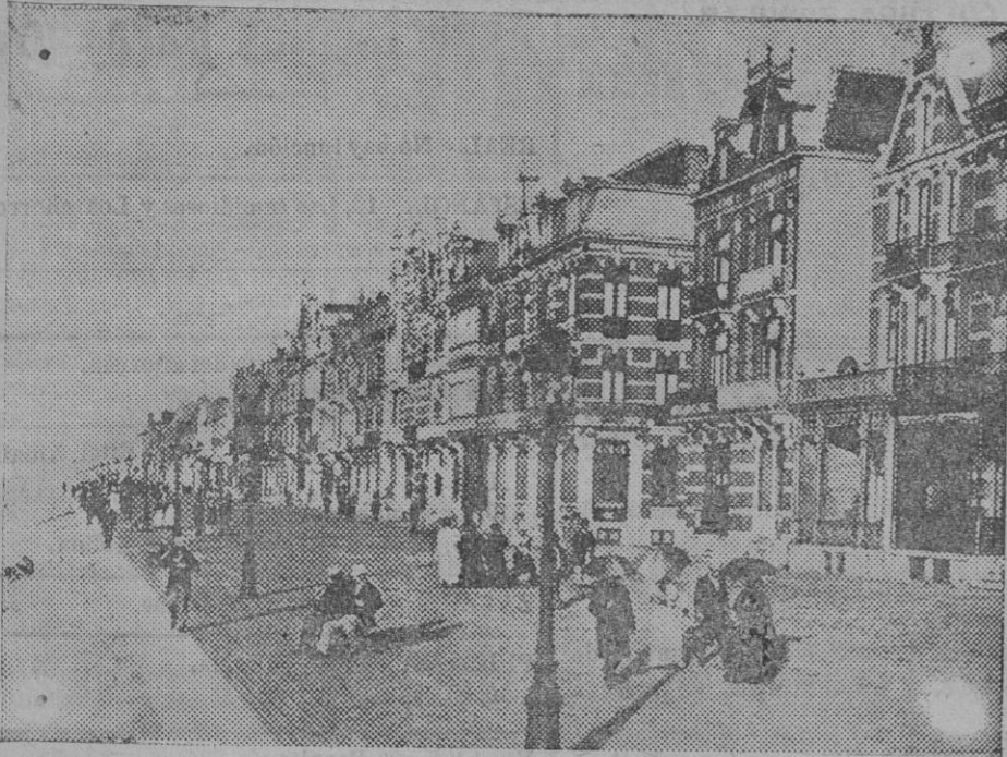
La villa de Blankenberghe.

ingresos resultan aumentados en 115 millones, y los gastos en 326, cifra de bastante importancia en las circunstancias actuales.