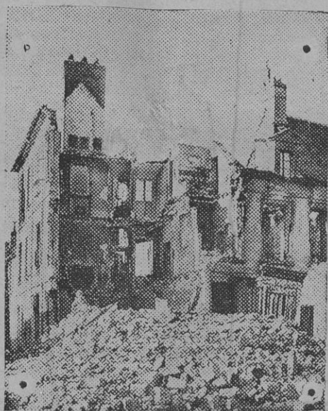
Ruinas de una casa de la calle de la República, en Senlis bombardeada por los alemanes.

Ahora falta conocer el resultado de las batallas del San y de Ivangorod. Si son