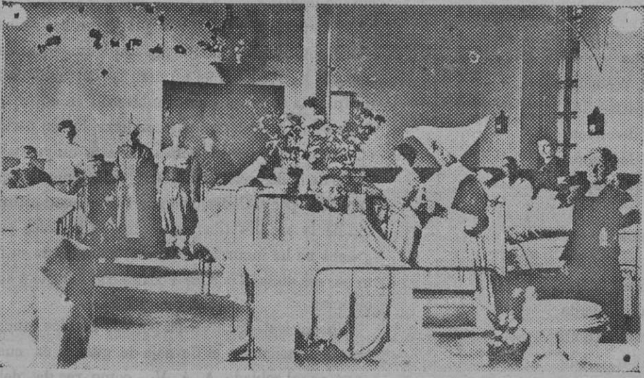
Interior de una ambulancia en Senlis, bombardeada por los alemanes.