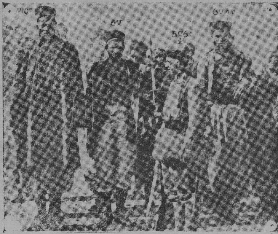
Un gigante fenegalés y otros soldados zuavos prisioneros de los alemanes custodiados por un soldado de la Guardia prusiana.

Lo interesante es que se atribuyera disgusto a tales ó cuales clases numerosas é importantes porque se había hablado y escrito acerca de nuestra falta de elementos para disponer de un ejército numeroso equipado, armado y