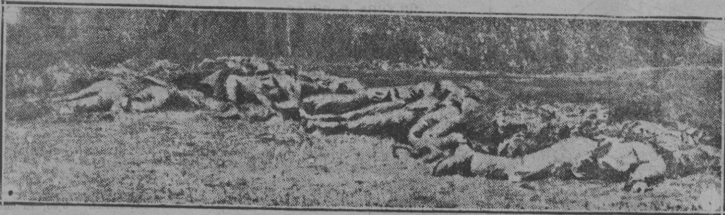
Soldados alemanes muertos junto a un bosque de Soissons, frente al enemigo, víctimas de su táctica de formación cerrada.