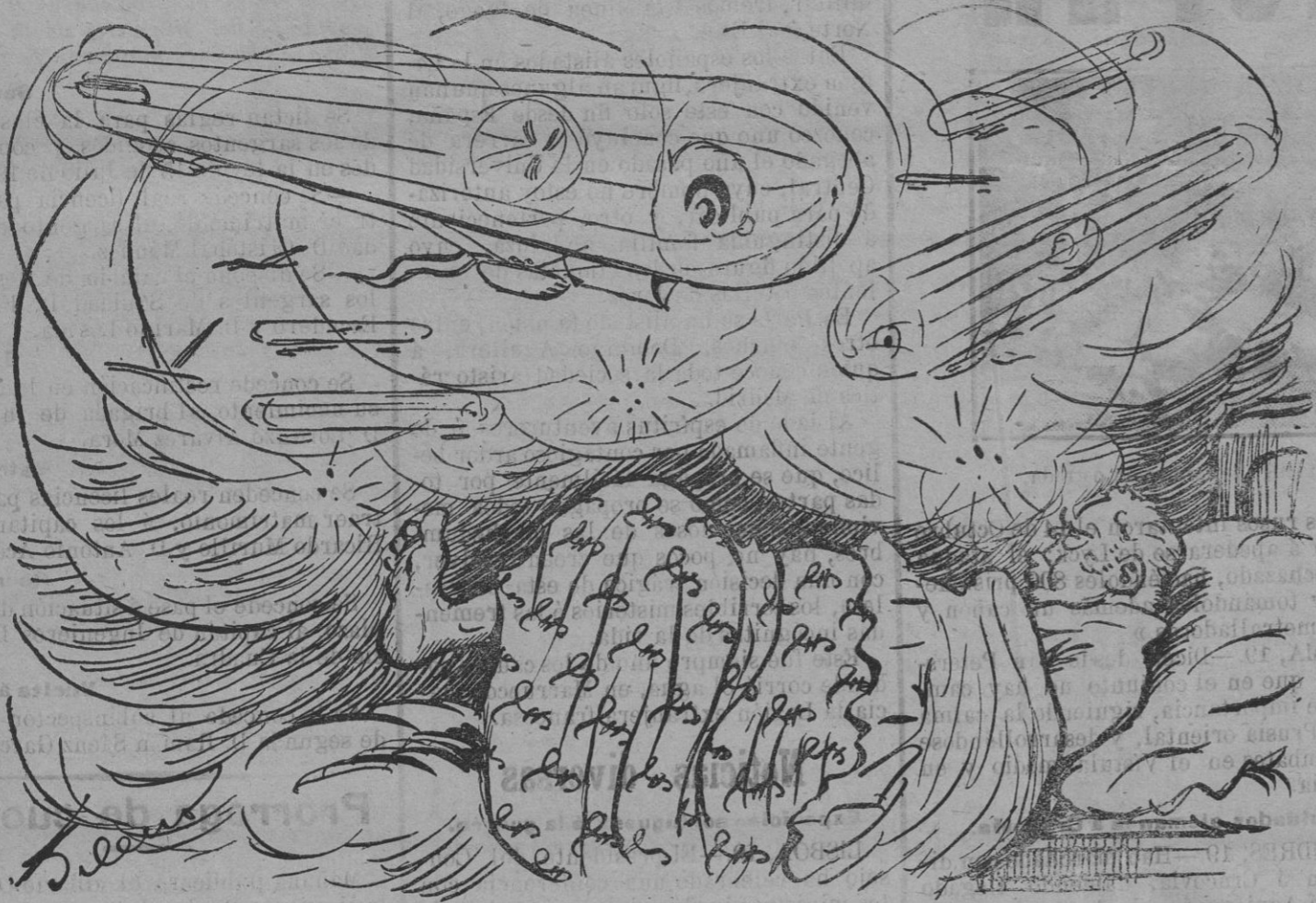
La pesadilla de «John Bull».