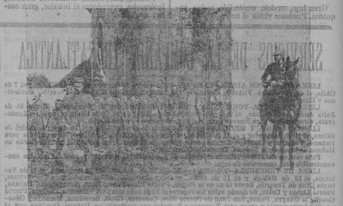
Prisioneros alemanes en Neuf montiers, al sur del bosque de Créay.

Anoche marchó a Zaira, y el viernes estará de regreso en Madrid, el Sr. La Cierva.