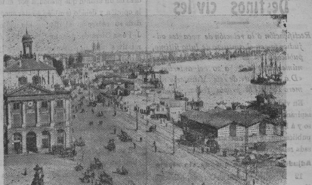
BURDEOS.—Los muelles. Vista tomada desde la Aduana.