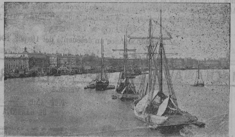
BURDEOS.—Los barcos de Tierra Nueva, en la rada.

ciales de los rusos sobre los alemanes y austriacos, que se repliegan sobre Cracovia.