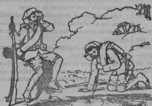
Grabado núm. 2.

Todas las aguas, aun las más diáfanas, contienen bacterias infecciosas. Nadie debe beber agua sin filtrar; sólo así se conservará la salud.