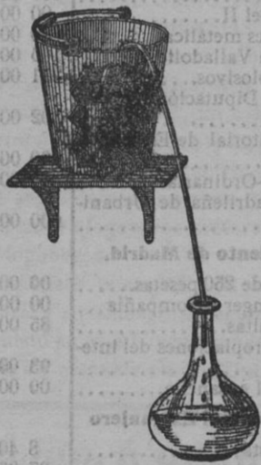
Grabado núm. 1.