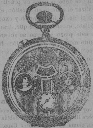
El maravilloso reloj automático

Para este servicio, rigen rebajas especiales en pasajes de ida y vuelta, y también precios convencionales para camarotes de lujo.