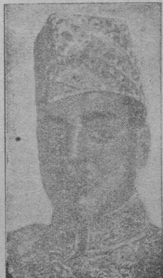
S.A. EL JALIFA

Philadelphia 8.—Han contraído matrimonio los artistas de la pantalla Ava Gardner y Frank Sinatra. El lugar donde se celebró la boda estaba protegido por seis policías.—Efe.