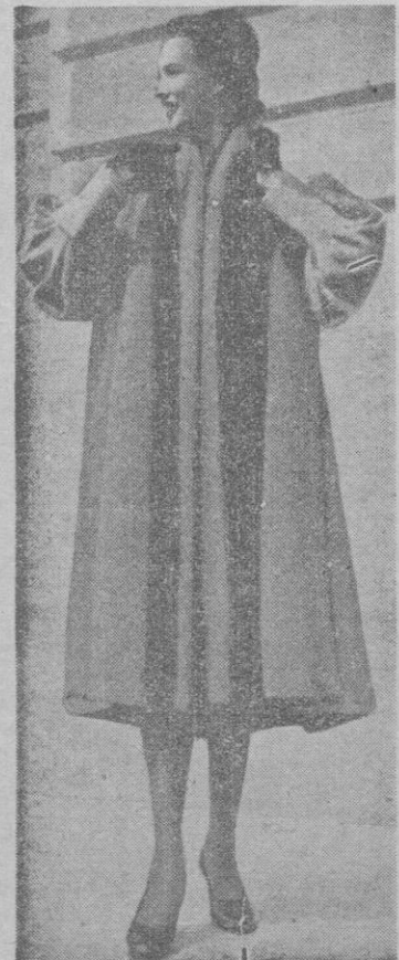
Color "beige", adornado con visón. De Jacques Heim. París.

Ya ha aparecido el tomo III de la "Vida ejemplar y heroica de Miguel de Cervantes" por Astrana Marin. El tomo lujosamente impreso e ilustrado con grabados, importa, en rústica, 300 pesetas. Es publicación del "INSTITUTO EDITORIAL REUS". Preciados 6 y 23. Madrid.