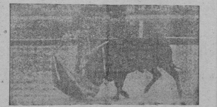
El posible profesor oficial de la Escuela Taurina Balear, Gabriel Pericás, en un magnífico derechazo.