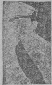
MAC. ARTHUR Guardián de los EE. UU. en Oriente

Hasta el momento, la sorda batalla entre Washington y Pekín no se había exteriorizado en situaciones de violencia. Ello obedeció, seguramente, a la extraña pasividad norteamericana ante el hecho terrorífico del avance de Mao Tse Tung por los territorios asiáticos.