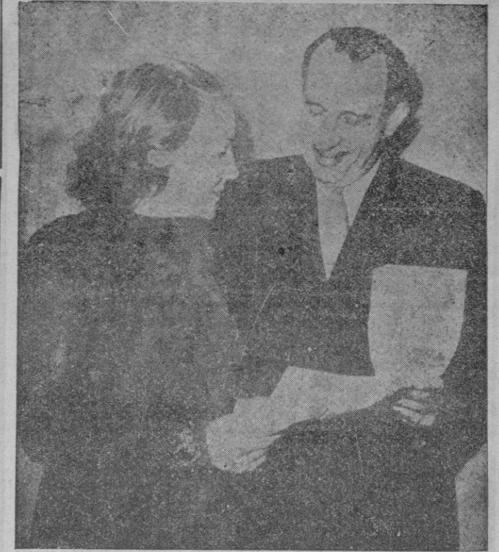
Una Agencia nos remite esta foto de la que reproducimos exactamente el pie original: "El Infante Don Jaime, Duque de Segovia, y su esposa recibiendo mensajes de diferentes partes del mundo animándoles a reclamar los derechos al Trono de España como hijo mayor del Rey Don Alfonso XIII. Retratados en su hotel de París el 8/12."

Seguidamente la Regidora Central de Cultura, Maruja Sanpela-