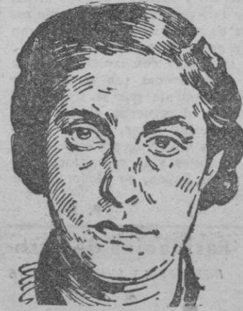
PILAR PRIMO DE RIVERA

3.652 comarcas y dijo que se continuará la labor de dar a conocer muchas canciones y danzas que permanecen olvidadas. Dió cuenta de los viajes realizados a Venecia, Londres, Suiza, Biarritz, Rabat y el triunfal por América.