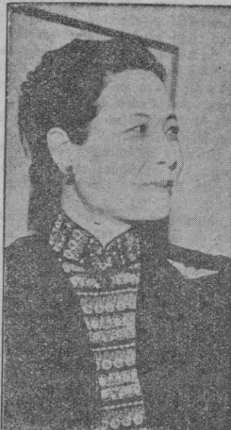
MEI-LING que en chino quiere decir "vida hermosa".

el mal, entre la libertad y el comunismo", ha dicho en un discurso la esposa del generalísimo Chang-Kai-Shek. "Espero que desde mi voz llegue —agregó— allí se sabrá comprender que China,