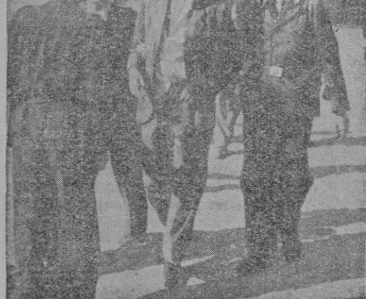
Así, a culatazo limpio, conduce la policía soviética a los prisioneros...