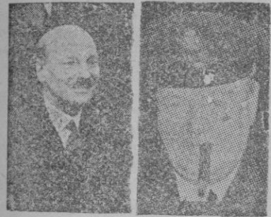
ATLEE y CHURCHILL "volverán a verse las caras"

UN TITULAR cargado de sugerencias colocábamos ayer en nuestra primera plana: "¿El ocaso del laborismo?" Era un comentario subjetivo, inspirado en el breve telegrama que anunciaba la celebración de próximas elecciones en Inglaterra. Su tono interrogativo —decimos— quedó impreso sobre el papel como augurio de tremendas preocupaciones para Gran Bretaña, y, de rechazo, también para el mundo entero.