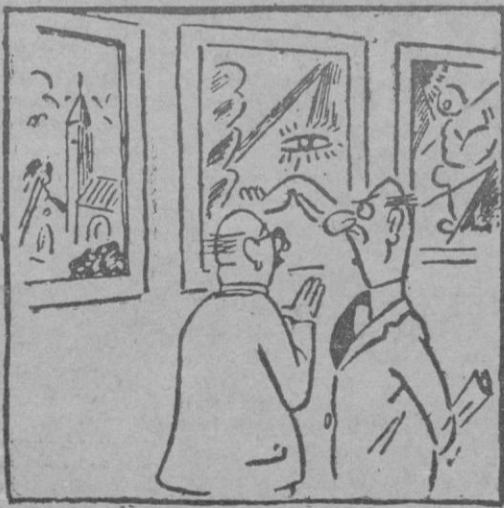
PINTURA MODERNA. — Por Cerdá — ¡Menos mal que veo un buen cuadro entre tanta mamarrachada! — No es un cuadro, es la ventana.

Washington 3. — En su conferencia de prensa, el Presidente Truman se negó a comentar un editorial de «Washington Post», según el cual está estudiando un magno proyecto de fabricación de bombas superatómicas a base de hidrógeno. — (Efe).