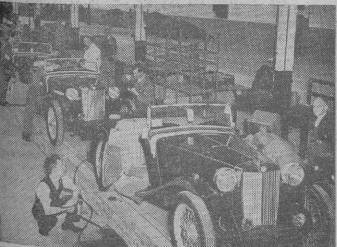
He aquí una foto de los primeros coches ingleses tipo «M.G.sport» de la postguerra, y que muy pronto serán exportados. Su precio en Inglaterra será de 479 Libras incluido el impuesto de compra.

Nueva York.—A bordo del transatlántico «Queen Elisabeth» ha llegado a esta capital el ex primer Ministro británico, Churchill, acompañado de su esposa, el cual fué recibido entusiastamente por la multitud.